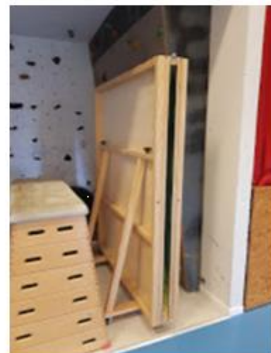
Speilet kan lett slås sammen og rulle s til siden.