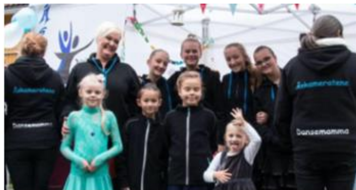
I fjor høst deltok Åskameratene på dansens dag i parken i Hønefoss, med nye klubbjakker på.