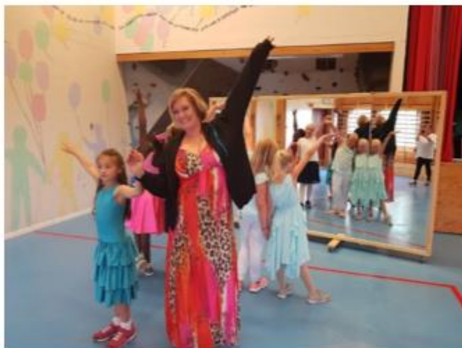
Med speilet kan danserne studere seg selv og danseteknikken.

I fjor sommer søkte vi Sparebankstiftelsen om penger til mobilt dansespeil, stereoanlegg og klubbjakker. Vi fikk 50 000,-!