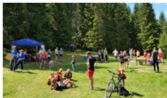
Yrende liv ved målgang på Jonsetangen.

Vi la inn 120,- i annonsering på Facebook, og ser at det ga en stor gevinst. Antall deltakere økte med ca 40% i forhold til fjoråret. Til stor glede var det også en stor andel nye fjes. Den mest spennende var en debutant på 72 år, fra Oslo som løp sitt første løp hos oss.